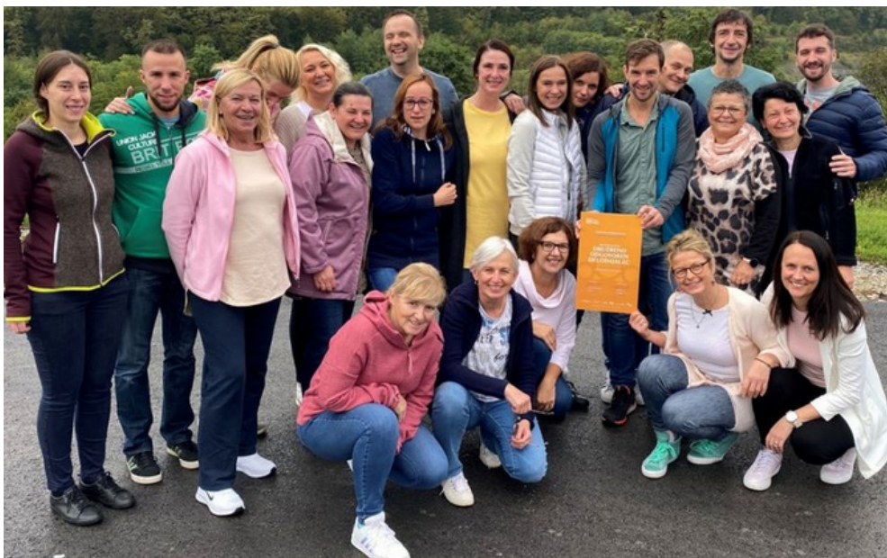
(Slika: pridobitev certifikata Družbeno odgovoren delodajalec)

Zavedamo se, kako pomembno je, da certifikat živimo, in da vsak prispeva svoje ideje in predloge k uresničevanju družbeno odgovornih aktivnosti.